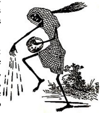
Shakchuni, fantôme de la femme mariée abusée

La course du fleuve me jeta sur une île des Sundarbans, la plus grande forêt de mangrove du monde, sur le delta du Gange. Protégeant le pays de nombreuses catastrophes climatiques et écologiques (cyclones démultipliés, pollution, réduction de la biodiversité, érosion et appauvrissement des sols), elle est menacée par l'explosion mondiale d'autres catastrophes du même type (montée du niveau de la mer, dérèglement climatique, imbroglio politique en matière de barrages, pollution des eaux...)