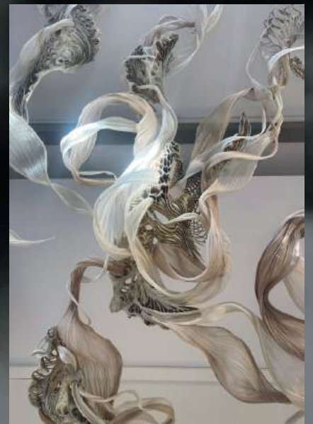
Iris Van Herpen